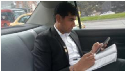
Suspenden vehículos a funcionarios de la Cámara de Representantes