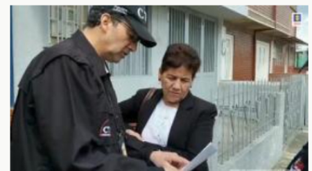
Judicializan integrantes de una red ilegal que comercializaba documentos