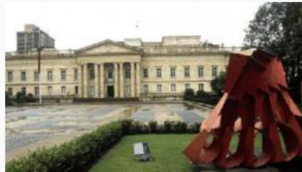
La comitiva de Estados Unidos que acompañará a Gustavo Petro en su posesión