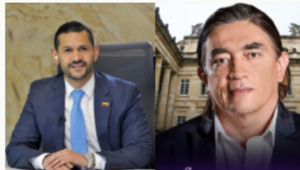
Polémica entre MinInterior y senador Gustavo Bolívar por una demanda