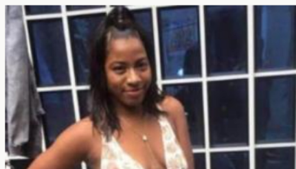
Candidata a reina de Carnavales de Tumaco fue incinerada presuntamente por su novio