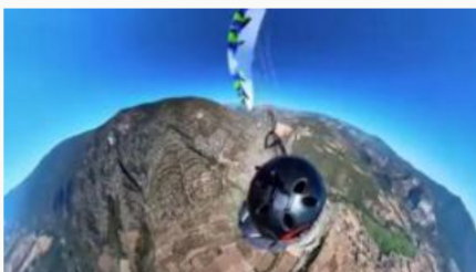
Paracaidista se salva de la muerte