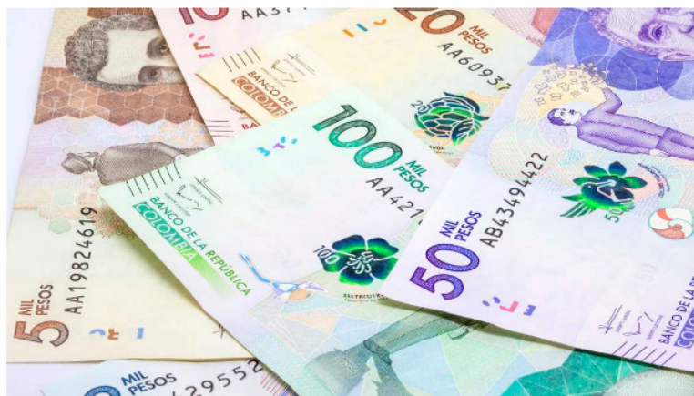
proyeta que su utilidad terminará este año incrementándose entre el 11 % y 18 %.

ISA, filial de Ecopetrol, cerró el segundo trimestre de 2022 con sólidos resultados financieros y operacionales que, según la compañía, se derivan de una estrategia financiera basada en la gestión eficiente de los gastos, las acertadas decisiones de negocio, el aumento en su desempeño operacional y la determinación por generar progreso en los países donde opera.