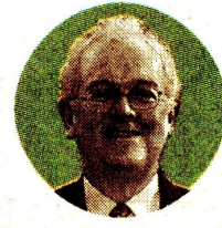
JOSÉ A. OCAMPO Ministro de Hacienda de Gustavo Petro

Manejar las finanzas públicas en un contexto marcado por necesidades de gasto marcadas, sumadas a un estrecho margen de maniobra por un apretado pa-