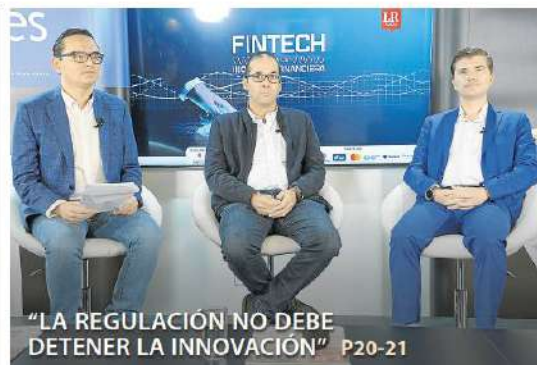
"LA REGULACIÓN NO DEBE DETENER LA INNOVACIÓN" P20-21

Dicha recuperación ha estado jalonada por el ingreso de más mujeres al mercado laboral (998.000 en marzo). A pesar de la alentadora noticia, la entidad también señaló que todavía hay 2,9 millones de personas sin empleo y que Quindío, Valledupar y Tunja tienen las mayores tasas de desocupación. P6