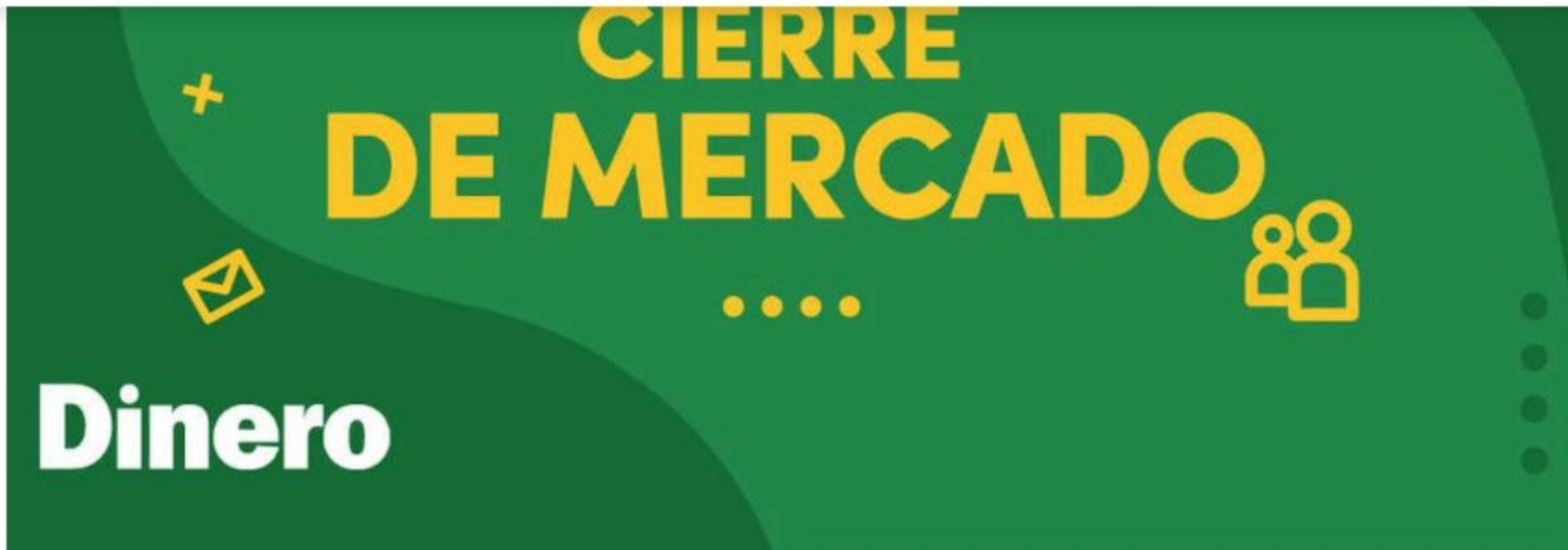
El principal índice de la BVC se desvalorizó un 0,04 % hasta las 1.575,37 unidades.

El índice MSCI Colcap de la Bolsa de Valores de Colombia finalizó la jornada de este martes con pérdidas. De esta forma, el principal índice de la BVC se desvalorizó un 0,04 % hasta las 1.575,37 unidades, lastrado por las acciones del sector energético.