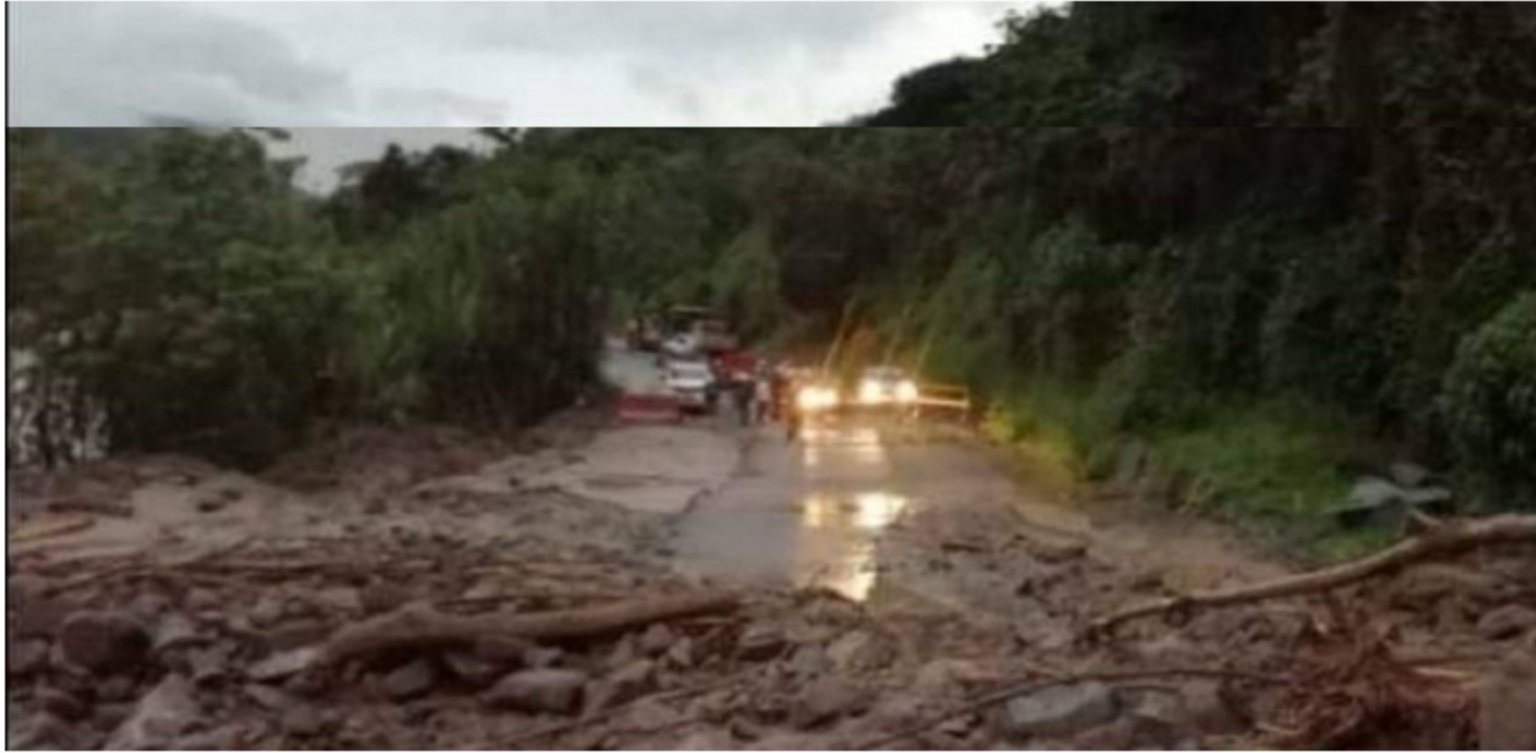
Derrumbe en el sector Arquía de la vía Felisa - La Pintada / Pacífico Tres

El cierre total se presenta en el sector del Puente Arquía. Sugieren tomar la vía alterna Medellín – La Dorada – Manizales.