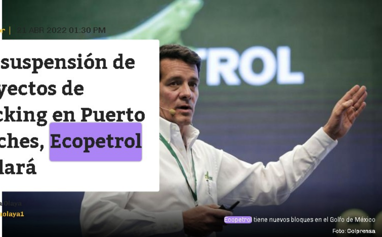
Ecopetrol tiene nuevos bloques en el Golfo de México