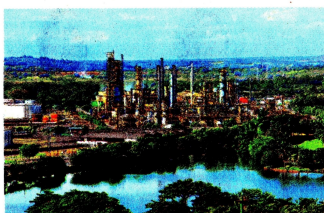
El presidente Iván Duque dijo que Barrancabermeja sería la primera ciudad en tener conectividad de 5G.

ya 44 millones de conexiones a internet, eso quiere decir que, sin lugar a dudas, en este año vamos a tener más de 45 millones de conexiones", recordó. Y apuntó que Colombia debe dar en 2025 con una conectividad 4G rural del 80 por ciento. Valderrama señaló además que entre los pilotos para la tecnología 5G ya se tienen 50 puntos reales y aplicaciones exitosas en distintos sectores.