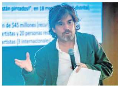
Secretaría de Cultura

El Programa Distrital de Estímulos (PDE), encabezado por Nicolás Montero , secretario de Cultura, Recreación y Deporte, lanzó su segunda fase con más de $11.400 millones en recursos para incentivar a los artistas, gestores culturales, patrimoniales y creadores que quieran presentarse a cualquiera de las 43 convocatorias que entregarán 749 estímulos en total. (JPVC)