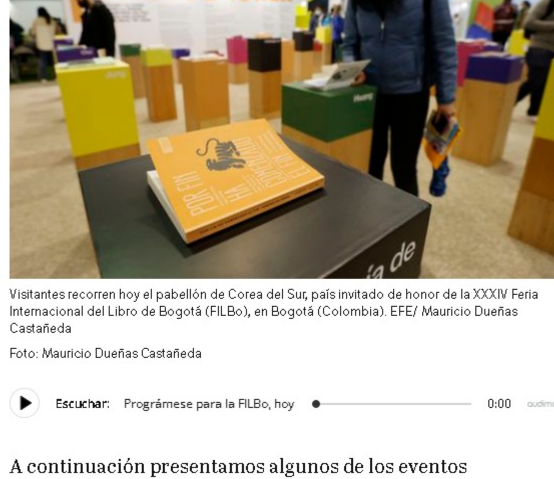
Visitantes recorren hoy el pabellón de Corea del Sur, país invitado de honor de la XXXIV Feria Internacional del Libro de Bogotá (FILBo), en Bogotá (Colombia).