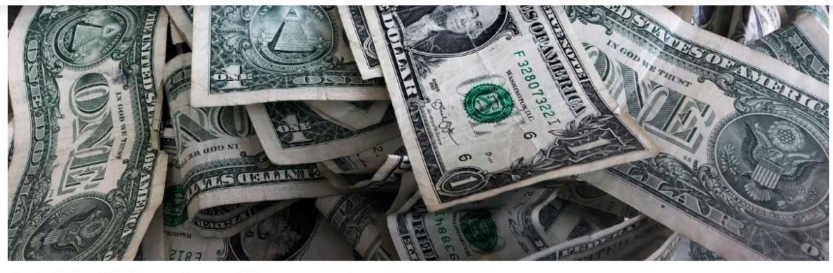
El precio del dólar en Colombia tuvo un incremento de 24 pesos con respecto a la TRM del día anterior.

Durante el cierre de la jornada del martes, el precio del dólar en Colombia subió 24 pesos, mostrando una leve recuperación en contraste con el comportamiento de la divisa durante los días previos .