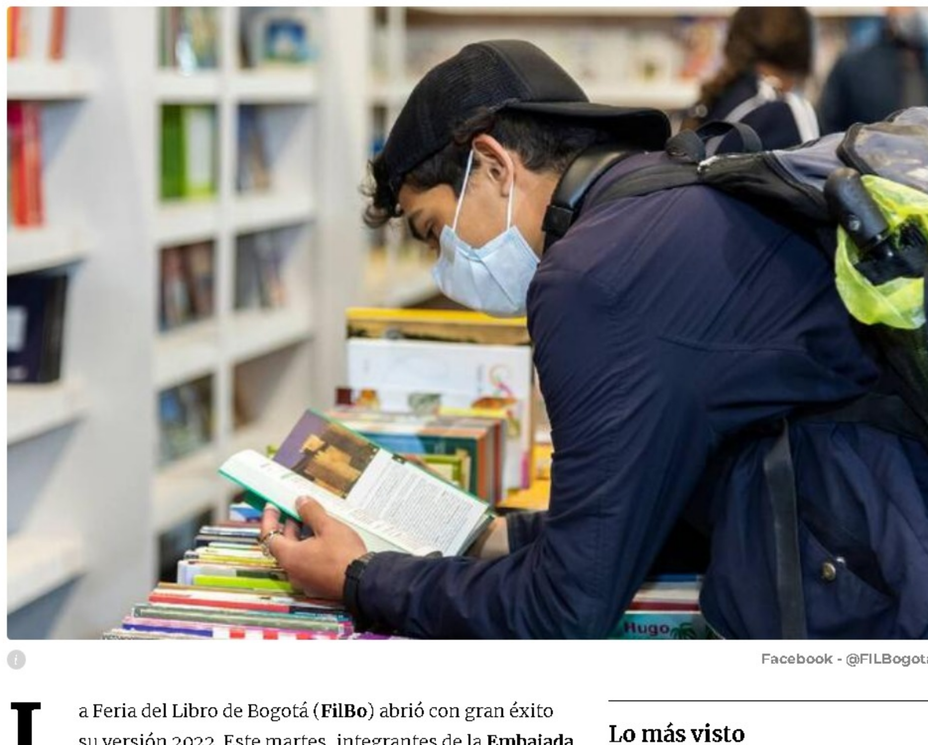
Facebook - @FILBogota

La Feria del Libro de Bogotá (FilBo) abrió con gran éxito su versión 2022. Este martes, integrantes de la Embajada de Corea del Sur y la Cámara del Libro dieron la bienvenida a los visitantes que vuelven a las instalaciones de Corferias tras tres años de virtualidad.