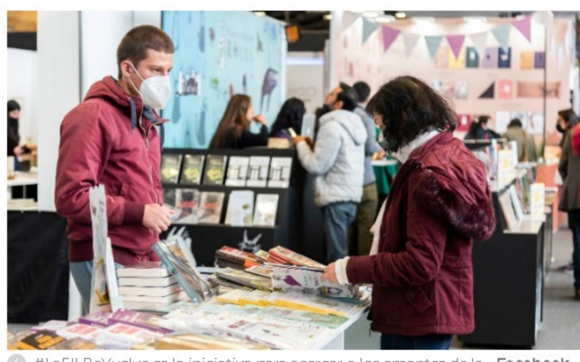
#LaFILBoVuelve es la iniciativa para acercar a los amantes de la lectura a las actividades, conversatorios y recobrar lo que ha estado perdido por casi dos años.

Asimismo, el periodista y youtuber colombiano, Daniel Samper , presentará su libro 'P de Colombia', uno de los textos que ha dado de qué hablar en la esfera política colombiana.