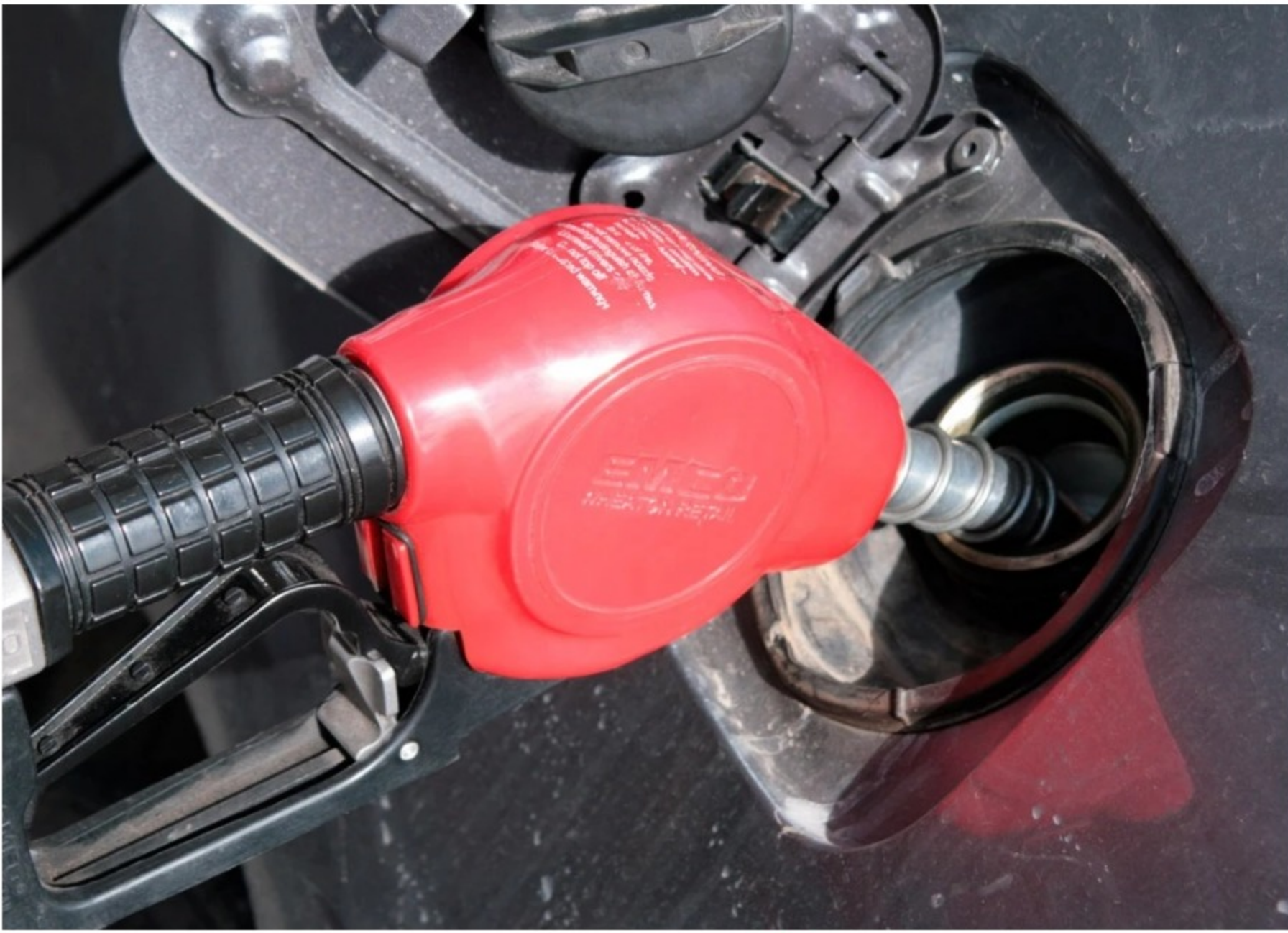
Precios de gasolina

El fondo de combustibles tiene un déficit de 14.3 billones de pesos. El Gobierno espera pagar la mayoría, pero la diferencia con los precios internacionales es enorme.