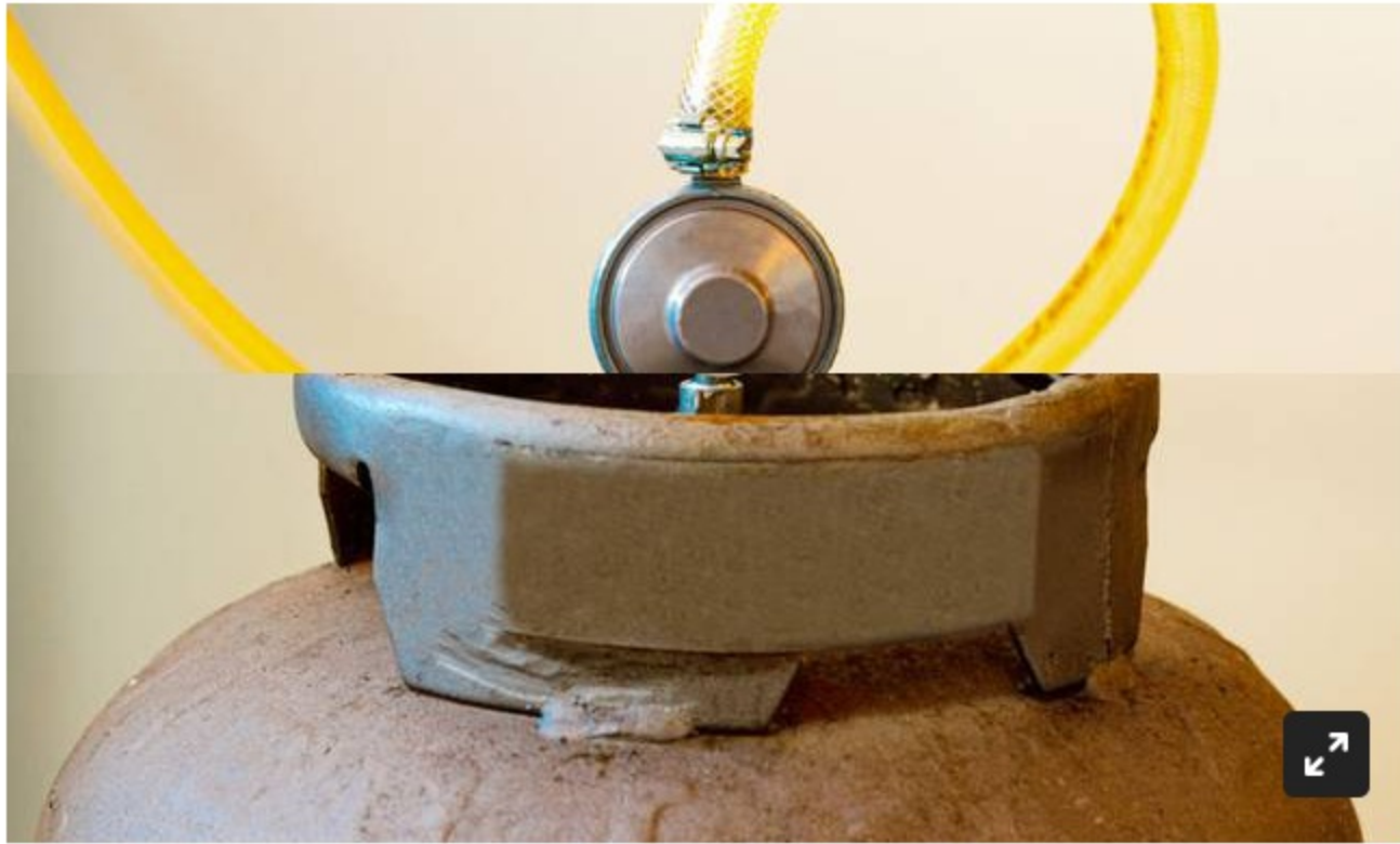
Imagen de referencia, cilindro de gas propano.

Desde la Asociación se pidió al Gobierno ampliar los subsidios entregados para el GLP.