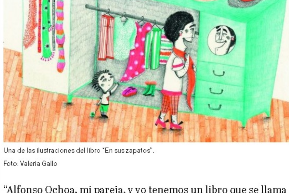
Una de las ilustraciones del libro “En sus zapatos”.

Para ella, al igual que para otros creadores, el insumo de su obra es producto de una mezcla de experiencias. Dice que, en su caso, el interés por darles visibilidad a las historias diversas proviene de los estudiantes transgénero que ha conocido ejerciendo como profesora de ilustración y narrativa gráfica en la Universidad Nacional Autónoma de México, pero también de su mismo núcleo familiar, que está conformado por su hijo y su pareja, que no es el padre biológico de él.