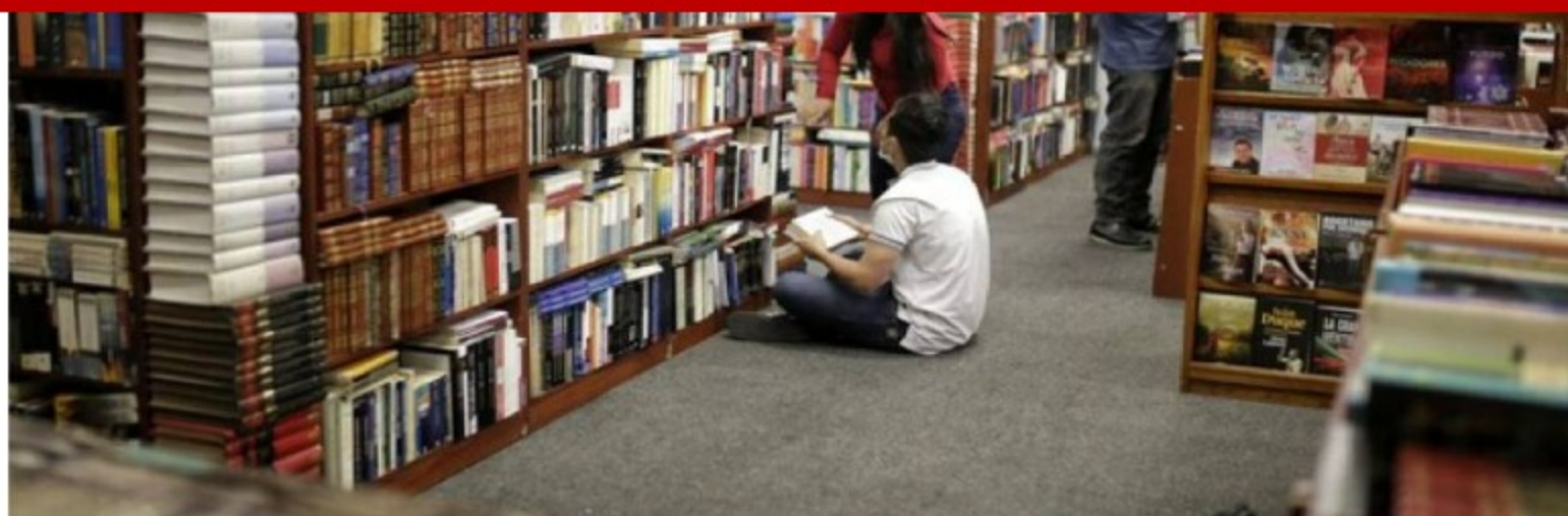
Feria Internacional del Libro de Bogotá 2022