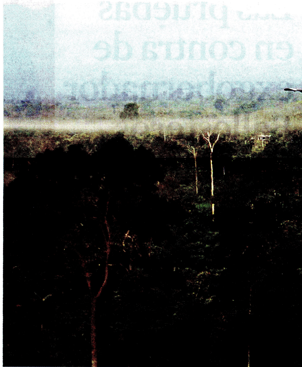
Las aspersiones aéreas con glifosato fueron suspendidas en 2015.

El abogado Negrete replicó que, si bien la ANLA actuó en los tiempos legales, para un proyecto tan complejo y pionero como el fracking , se requería más rigurosidad, involucrar a otros actores, contratar expertos internacionales y garantizar derechos. “En aras de la agilidad, por cumplir una formalidad, no se respetaron derechos fundamentales. Se cercenó a las comunidades su opción de acceder a información y participar