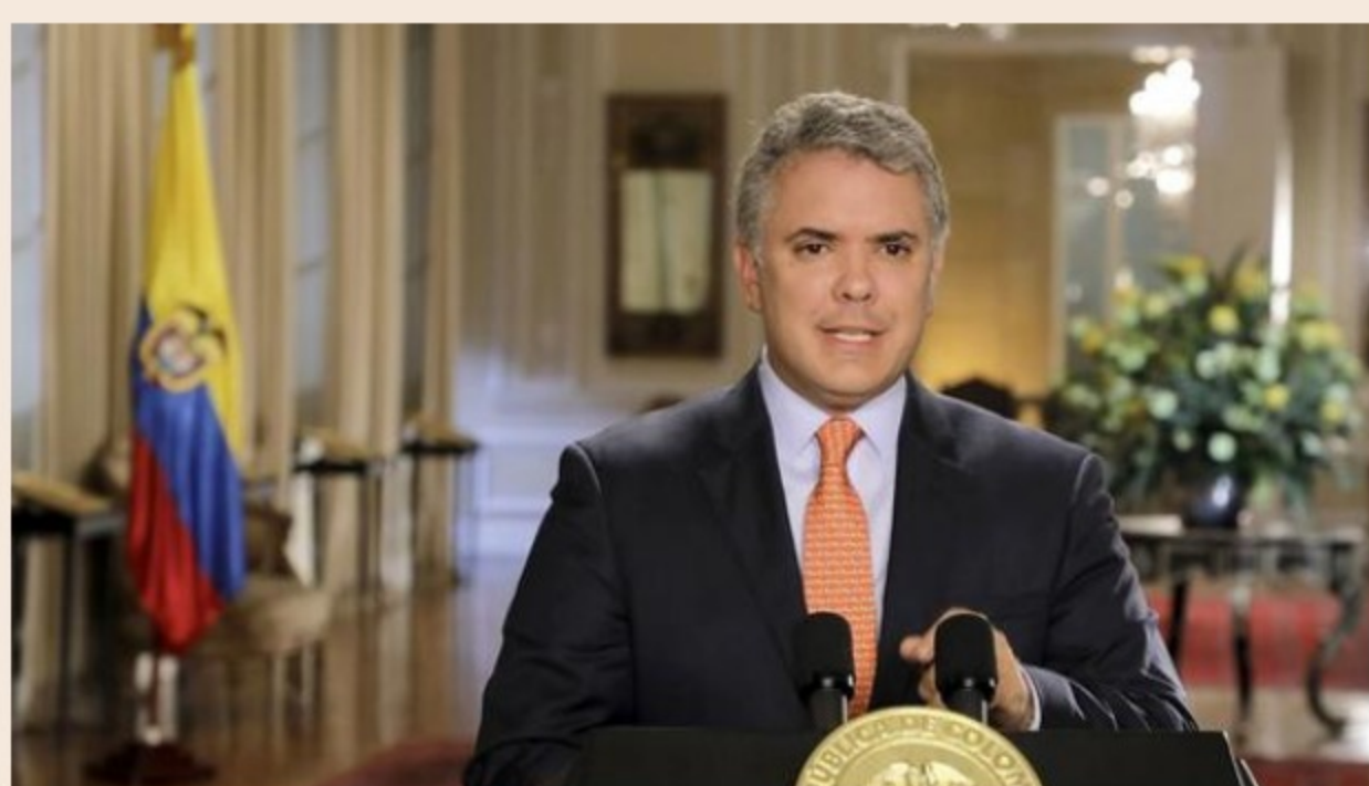
La reciente aprobación de un piloto de fracturación hidráulica causó revuelo en Colombia, después de que el presidente, Iván Duque, prometiera durante la campaña electoral del 2018 que mientras él ocupara la Casa de Nariño no habría fracking.

El fracking permite extraer el gas de esquisto, un tipo de hidrocarburo que se encuentra en capas de roca a gran profundidad, por lo que se tiene que perforar la tierra para después inyectar grandes cantidades de agua mezclada con químicos a alta presión.