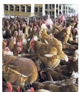
Una granja de aves.

“Esta certificación es un reconocimiento a la labor de los productores avícolas, quienes son conscientes de la importancia que tiene la producción de alimentos sanos y de calidad, para brindarle al consumidor un producto final con todas las condiciones de