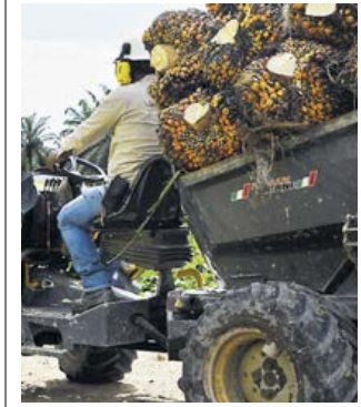
Carga de palma de aceite.

Con la producción nacional se atendió a todos los segmentos del mercado local: biodiésel, industria tradicional de alimentos, concentrados animales y otras industrias.