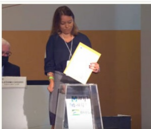
Representante do consórcio Shell e Ecopetrol

Por Davi de Souza ( davi@petronoticias.com.br ) –