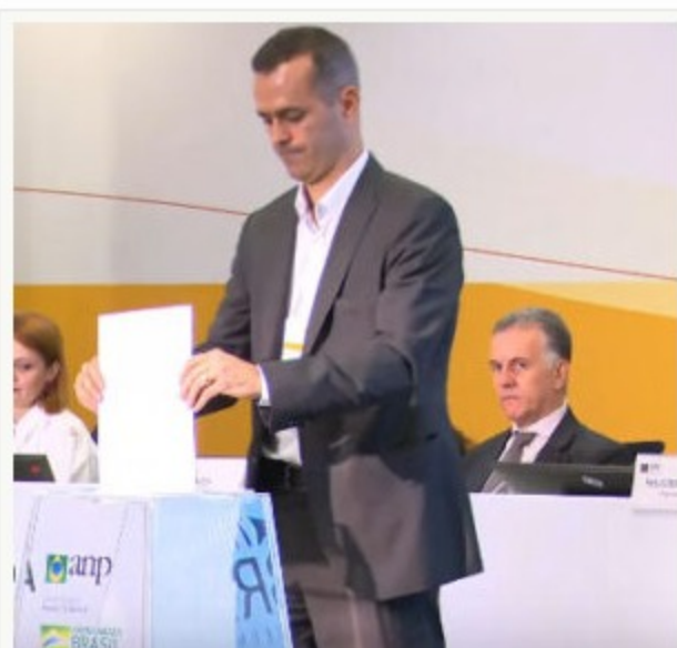
Representante da TotalEnergies

Acompanhe ao vivo a sessão de apresentação de ofertas: