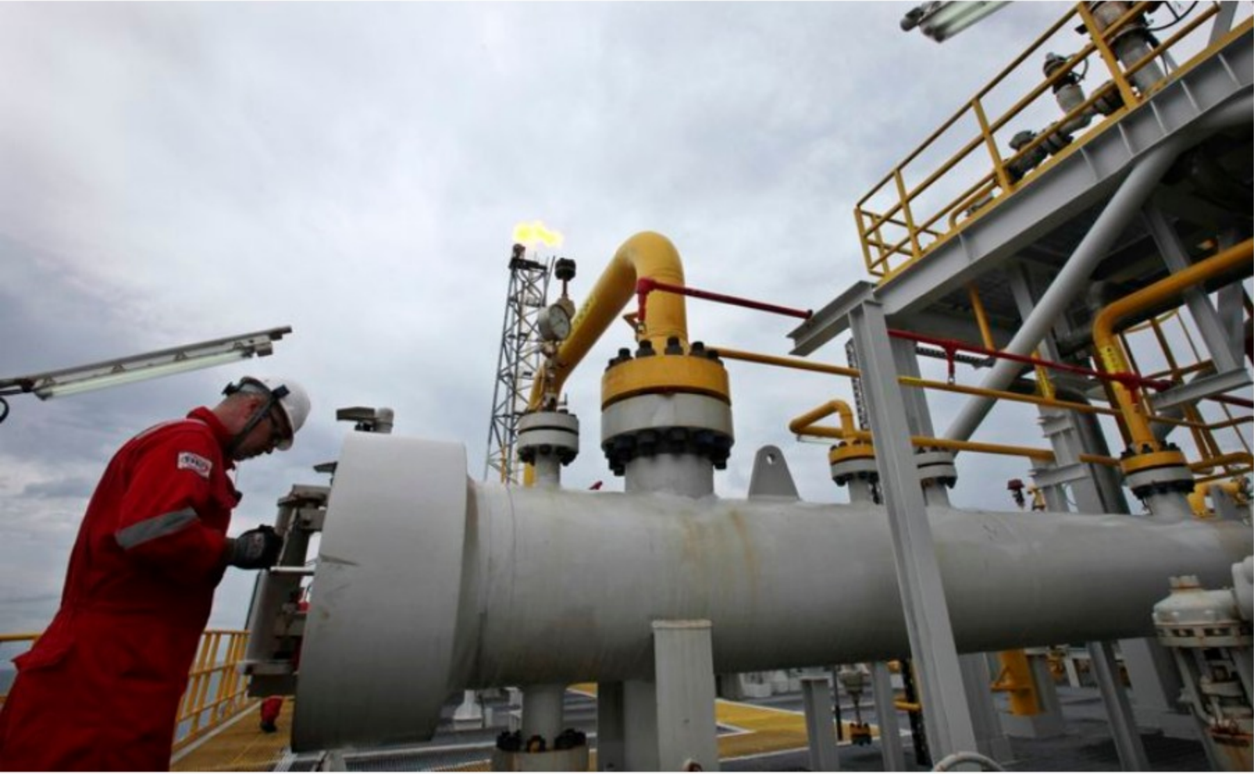
trabajador de campo del presal

13/04/22 - 16:34 - Actualizado 13/04/22 - 16:35