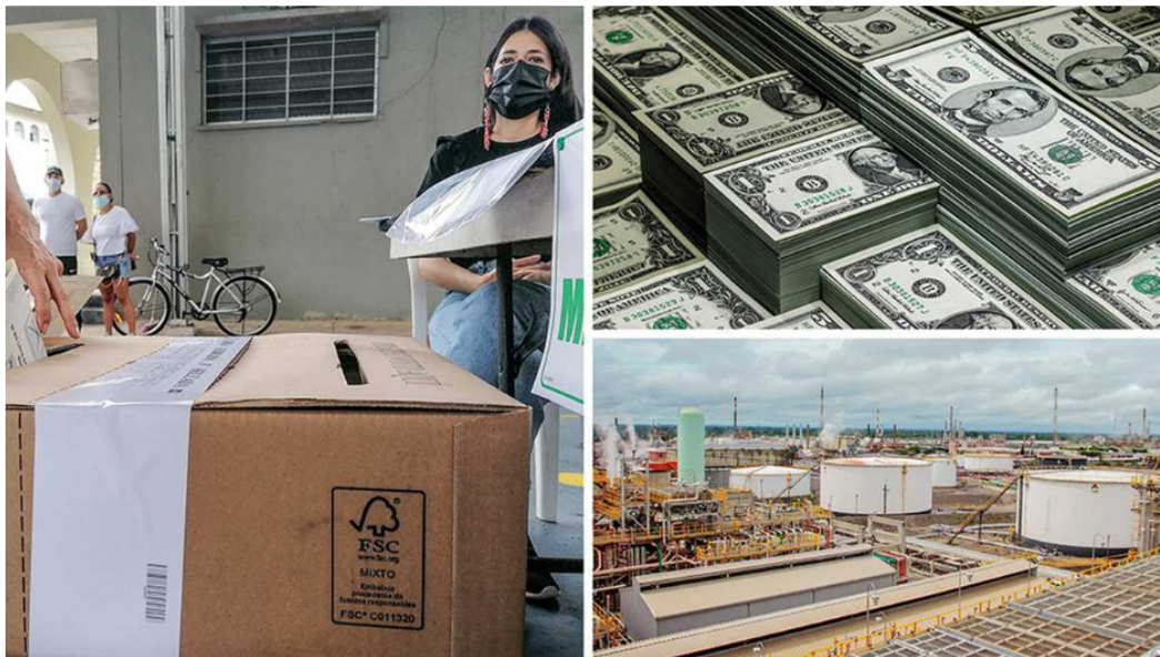
El precio del dólar hoy se mueve al ritmo del petróleo . No obstante, el proceso electoral ha impedido que baje más.

En lenguaje náutico se dice que hay calma chicha cuando el clima en el mar está tranquilo, especialmente luego de la tempestad o antes de que se desate una. Algo similar ocurre hoy con el dólar en Colombia; tras dos años de pandemia, alcanzó a estar por encima de 4.150 pesos, pero hoy se encuentra por debajo de 3.800, en una movida que nadie se esperaba.