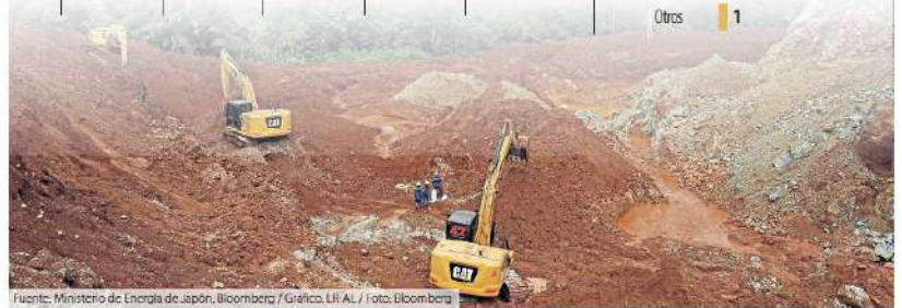
Fuente: Ministerio de Energía de Japón, Bloomberg / Gráfico: LR AL / Foto: Bloomberg