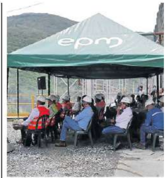
Delegados de las compañías evidenciaron los avances del proyecto, que operará el 26 de julio.

BRIGITH BARONA bbarona@larepublica.com.co