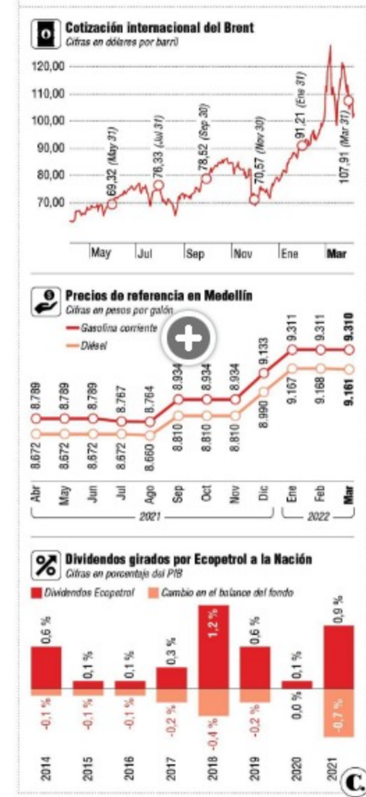
VALORES DINÁMICA DE LOS PRECIOS DE COMBUSTIBLES