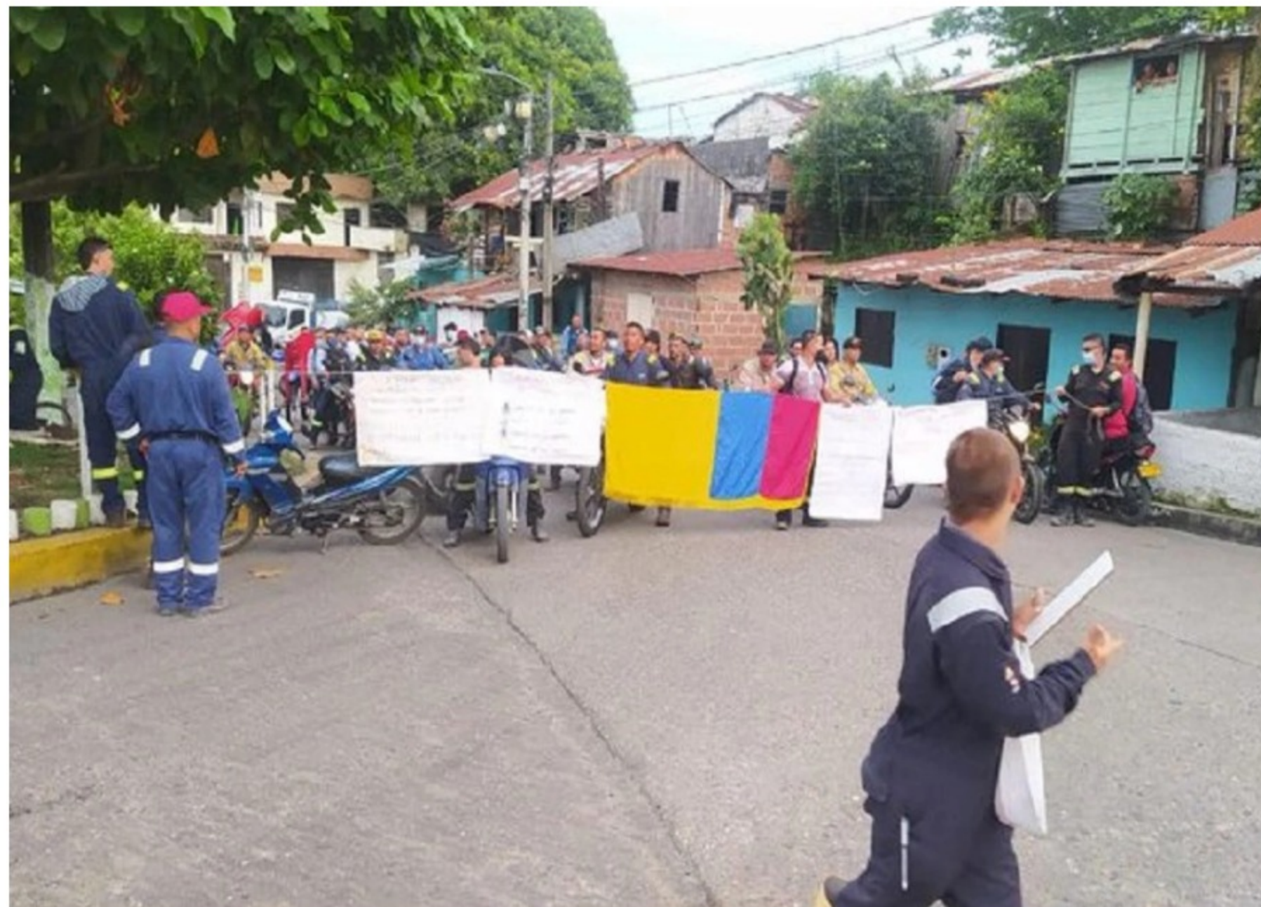
Protesta en Cimitarra, Santander.

Trabajadores de la empresa Cenit , filial de Ecopetrol , no han podido salir de la plata por las manifestaciones.