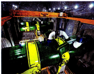
El proyecto de modernización de la hidroeléctrica tuvo una inversión de 120 millones de dólares.

Las obras ejecutadas permiten darle un manejo técnico al proceso de sedimentación na-