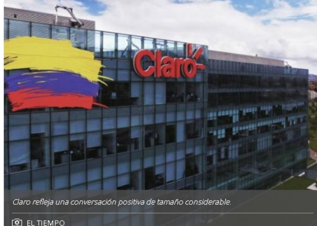
Claro refleja una conversación positiva de tamaño considerable.

También menciona que Claro refleja una conversación positiva de tamaño considerable, derivada de una activación en la que vinculó a un artista, pero estas interacciones contrastan con el volumen de conversaciones alusivas a inconformidades por los servicios.