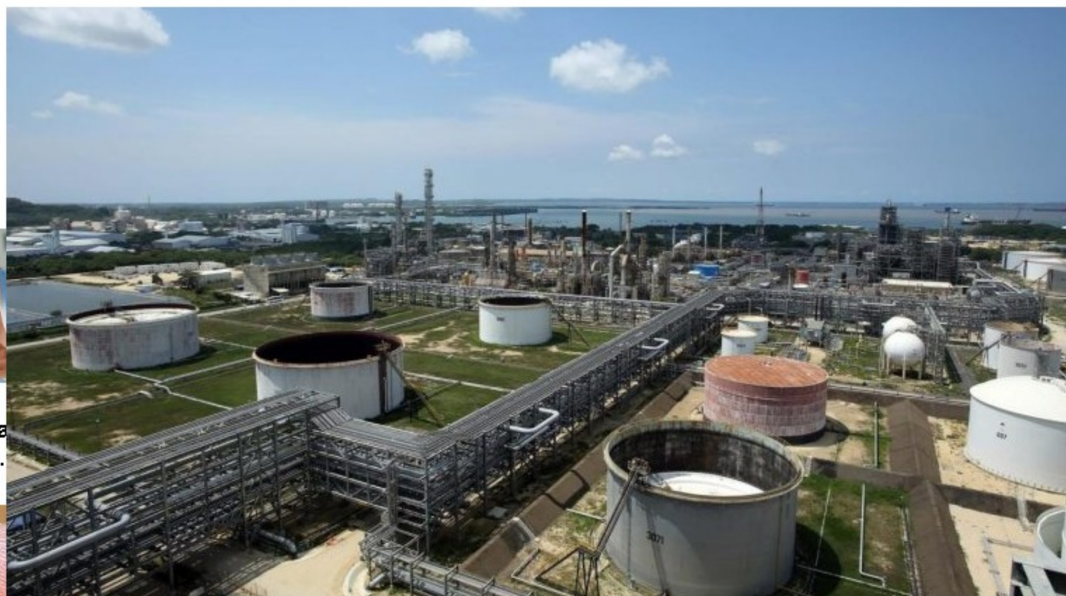
Vista general de las instalaciones de la Refinería de Cartagena (en rojo) en Cartagena (Colombia), en una fotografía de archivo.

Bogotá, 7 abr (EFE). - El colombiano Grupo Ecopetrol redujo sus emisiones a la atmósfera en 493.441 toneladas de carbono entre el año 2020 y 2021, lo que equivale a restaurar un área aproximada de 50.000 hectáreas, informó este miércoles la compañía.