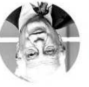
Josep Borrell, Representante de la Comisión Europea

El Kremlin está encontrando maneras para saltarse a las sanciones. El país se ha agotado para el próximo mes y varias empresas chinas usaron moneda local para comprar carbón ruso en marzo. Los flujos de gas de Rusia a Europa han aumentado desde la invasión del 24 de febrero. Ninguno de estos esfuerzos a restricciones.