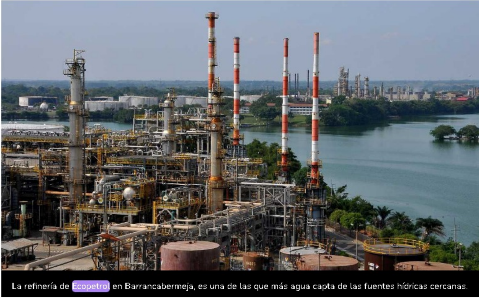
La refinera de Ecopetrol en Barrancabermeja, es una de las que más agua capta de las fuentes hídras cercanas.

El año pasado, la refinera de Barrancabermeja reutilizó de manera sostenible más de 12 millones de metros cúbicos de agua, equivalentes al 56% del agua captada.