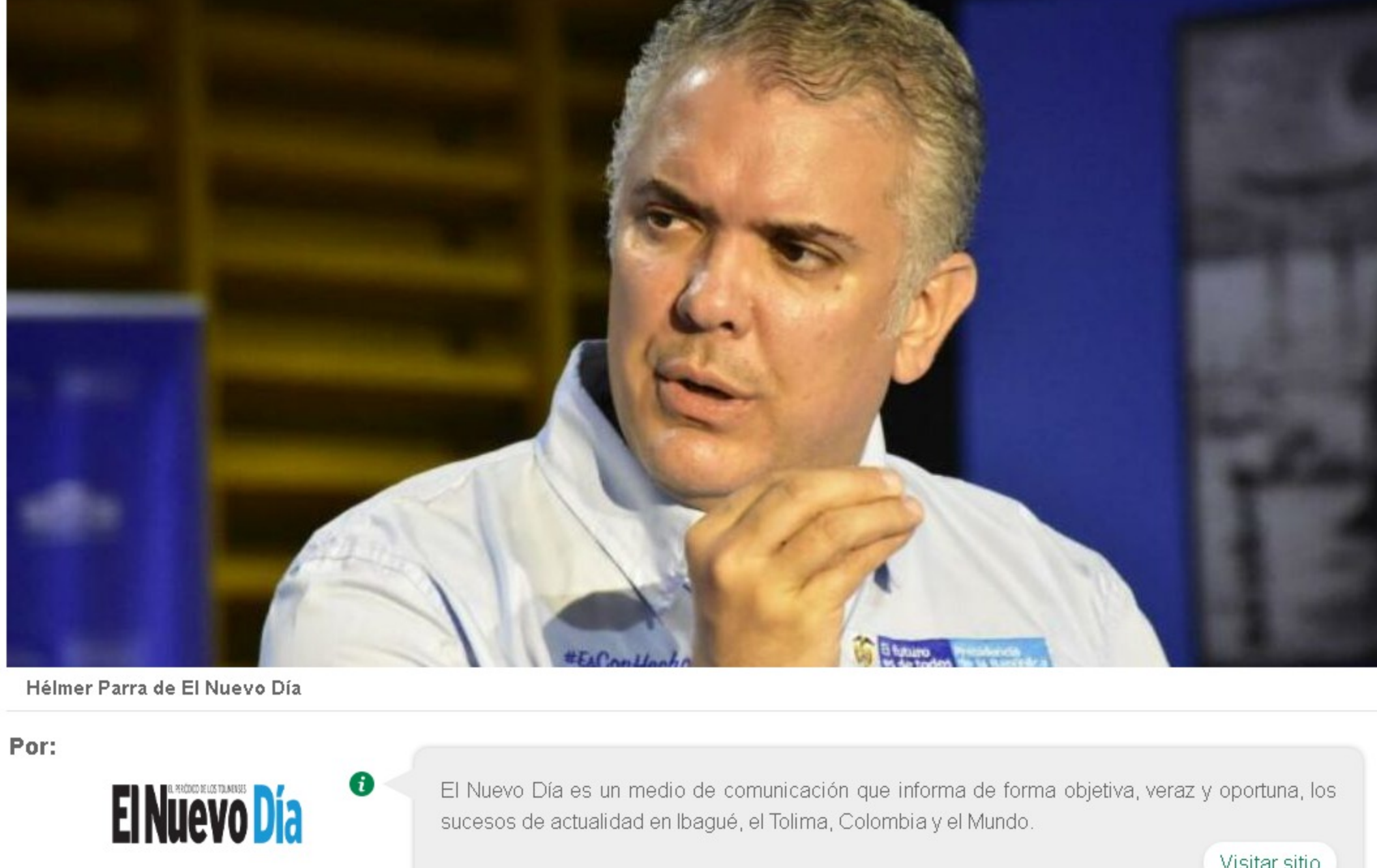
Hélmel Parra de El Nuevo Día

COMPARTIR TWITTEAR ENVIAR SIGUENOS EN GOOGLE NEWS