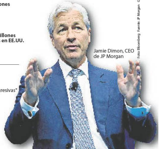
Jamie Dimon, CEO de JP Morgan

Gráfico: LR-MW