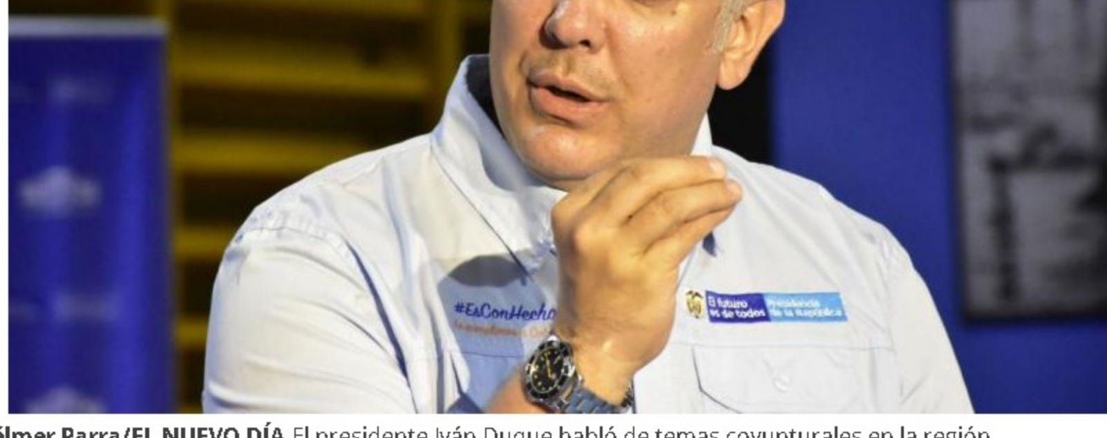
El presidente Iván Duque habló de temas coyunturales en la región.

El Nuevo Día Ibagué Tolima Judicial Colombia Política Económica Deportes Opinión Actualidad Ver más