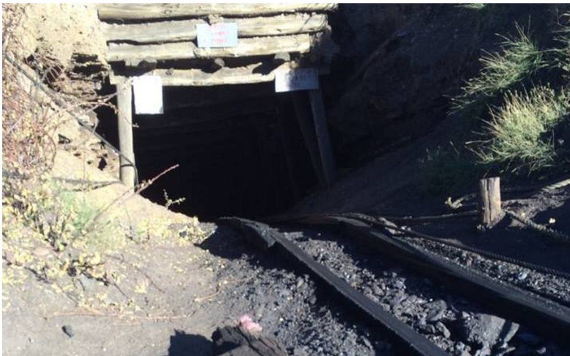
Mina de carbón.

El accidente en la mina Carlota 2 se debió, según la ANM , a la "acumulación de gas metano dentro de la mina".