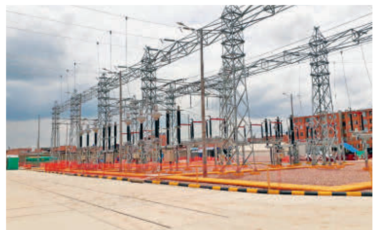
El próximo 26 de octubre será la adjudicación de la subasta de energía que está a cargo de XM.

una vez más que el marco regulatorio, fiscal y la puesta en marcha de políticas públicas innovadoras, han hecho de la Transición Energética de Colombia una realidad. Esta tercera subasta nos permitirá aumentar aún más la participa-