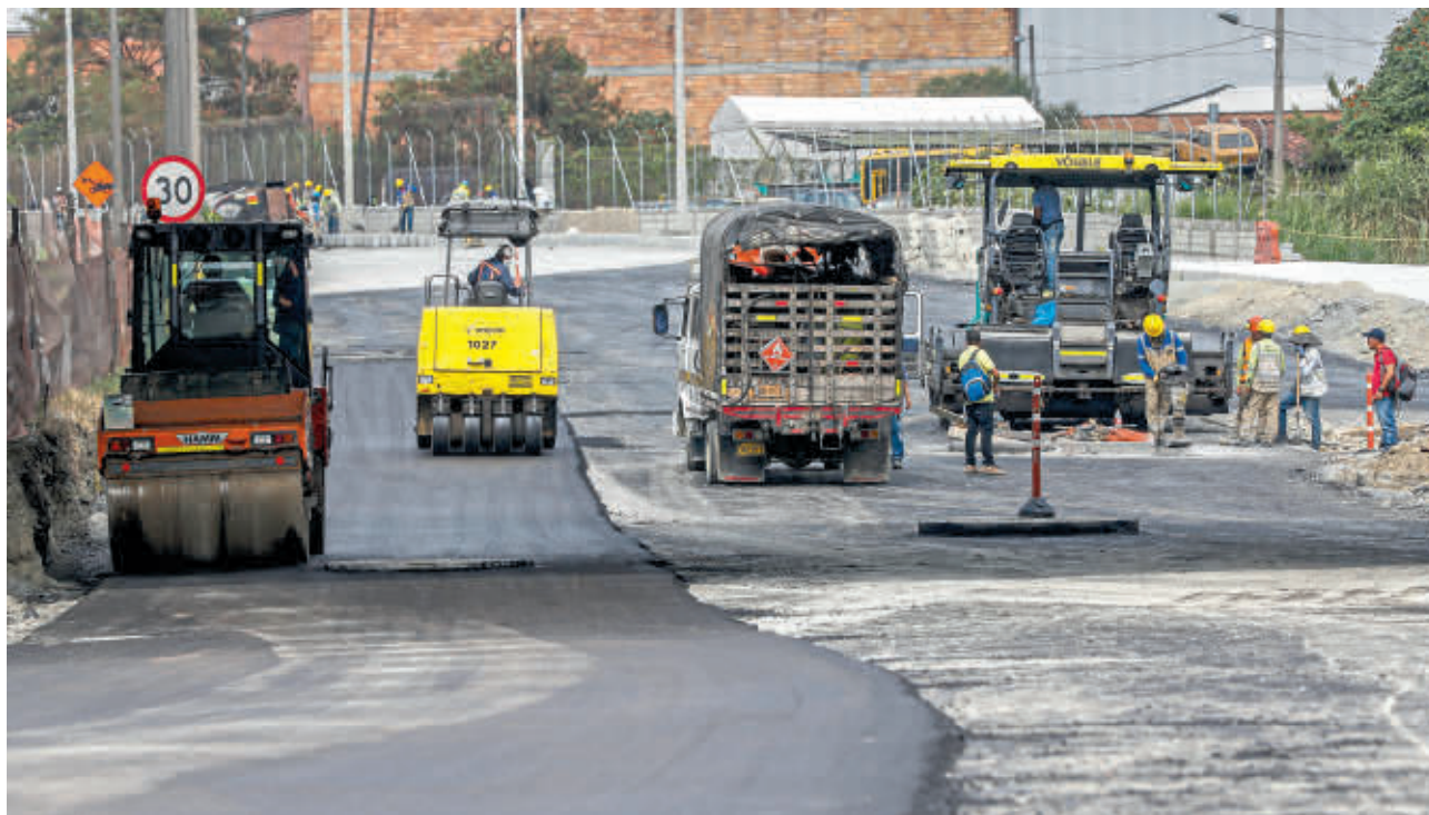
Según MinTransporte se están adelantando mesas de trabajo con Ecopetrol para discutir si habrá o no un incremento y, de ser así, este de cuánto sería.