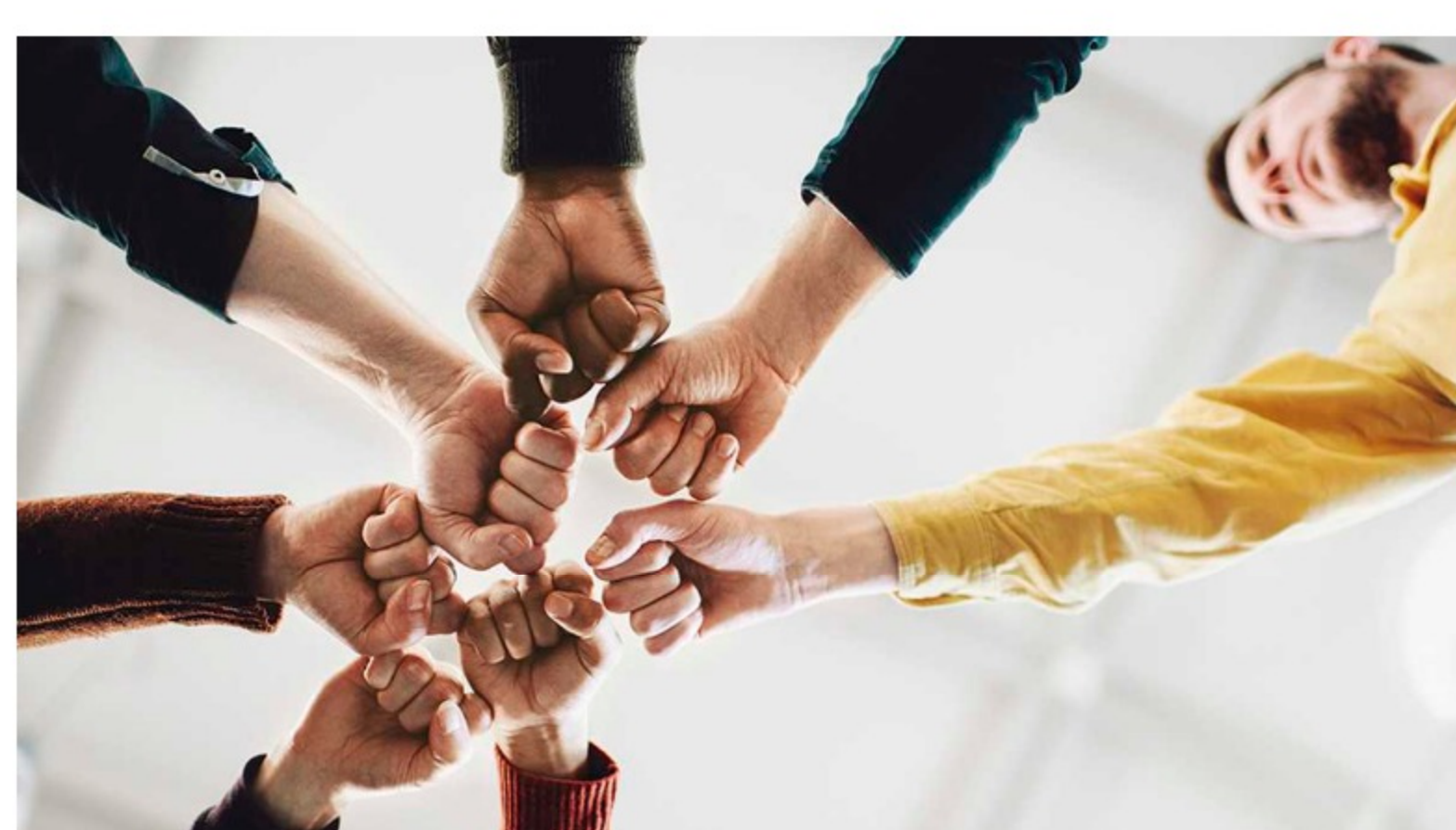
Una de las tendencias de inversión corresponde a los Fondos de Inversión Colectiva, permiten a las personas con pocos recursos acceder a los mercados financieros con menores costos.

Más allá de cuál opción de inversión se elija para agrandar el ahorro, lo importante es tener presente que, en lo que resta de 2021, se seguirán sintiendo los efectos positivos y negativos de la pandemia, y que así como tocó aprender a vivir con tapabocas, también hay que aprender a invertir con volatilidad, con asesoría de expertos y aprovechando las nuevas alternativas.