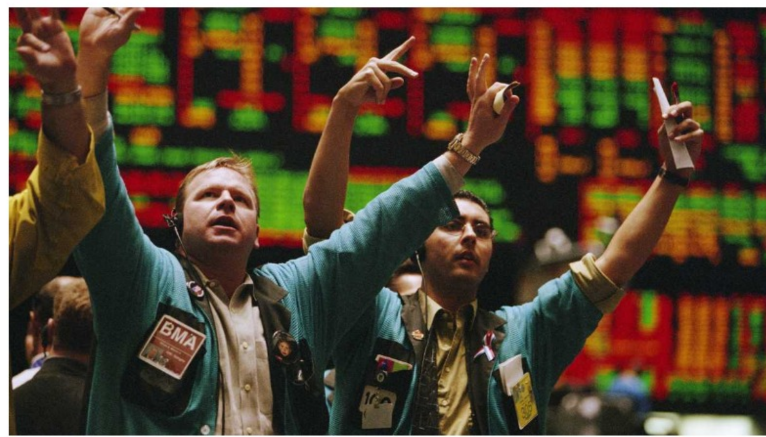
Mientras en Colombia las acciones aún no levantan cabeza tras la caída de 2020, en Estados Unidos y en Europa las bolsas muestran buenos rendimientos.

Mientras en Colombia las acciones aún no levantan cabeza tras la caída de 2020, en Estados Unidos y en Europa las bolsas muestran buenos rendimientos. De hecho, en la AFP Protección explican que el tener parte de su portafolio invertido en el exterior les ha servido para compensar la caída de las acciones colombianas.