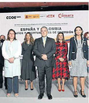
Ministerio de Comercio