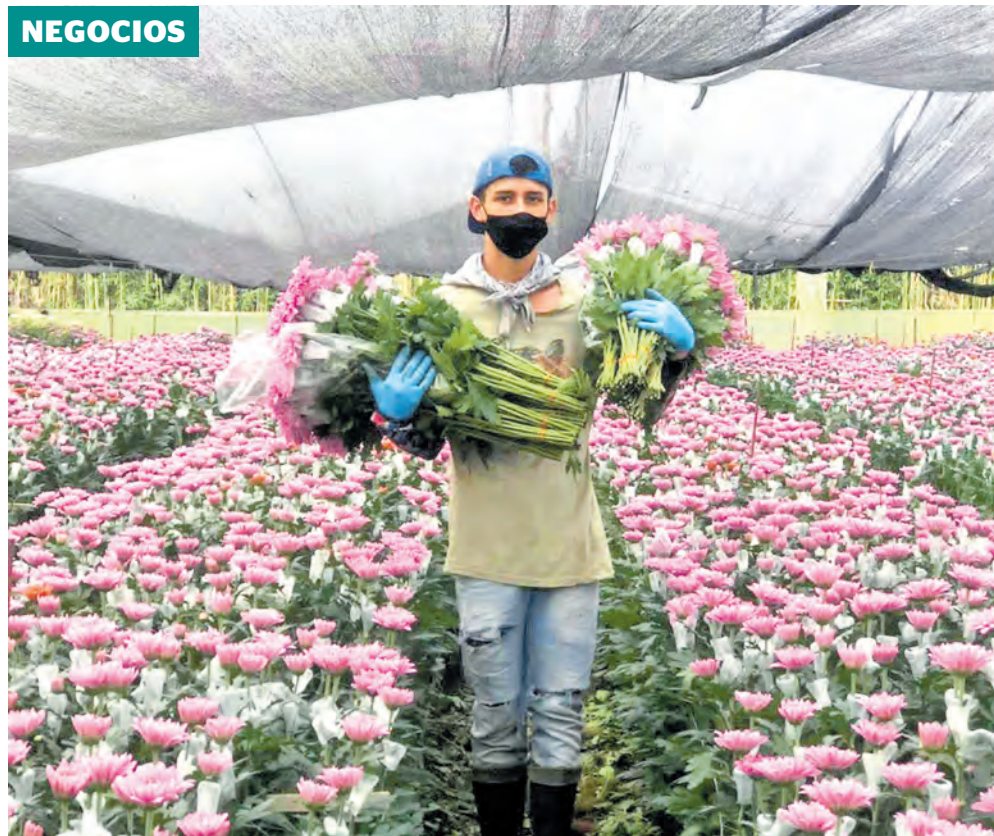
El sector floricultor del país es uno de los que mejores perspectivas tienen con esta fecha.