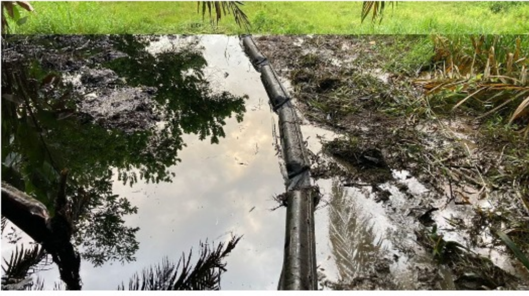
El incendio fue controlado y no llegó a la línea de transferencia.

En la noche de este domingo actores desconocidos atacaron con explosivos el oleoducto de Ecopetrol, ubicado en el corregimiento El Centro, de Barrancabermeja.