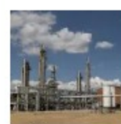
Se soluciona de manera gradual falla de gas natural en Cusiana, Casanare