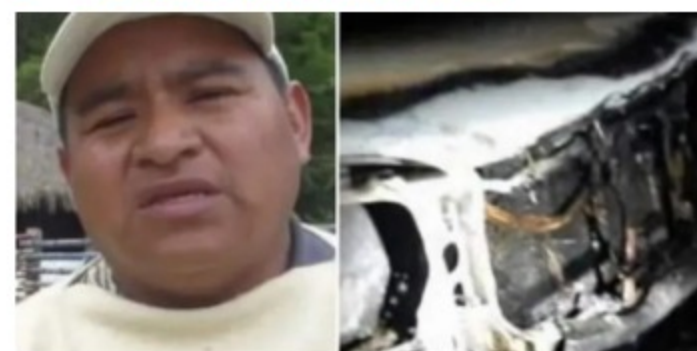
Atentan contra líder indígena por captura de disidentes