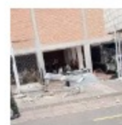
Ataque con explosivos a estación de Policía en Cúcuta