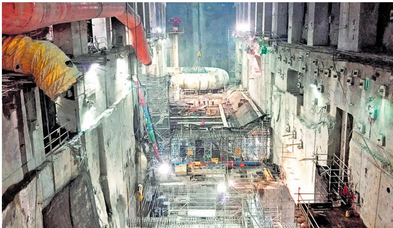
El proyecto de Hidroituango aportará el 20% de la energía al país con 2.400 megavatios (MW) de capacidad instalada. A.L.S.

Recursos comprometidos frente a los apropiados a julio estaban respectivamente en 25,7% y 30,7%. Presidencia, TIC y Comercio, con los mejores balances. Pág. 6