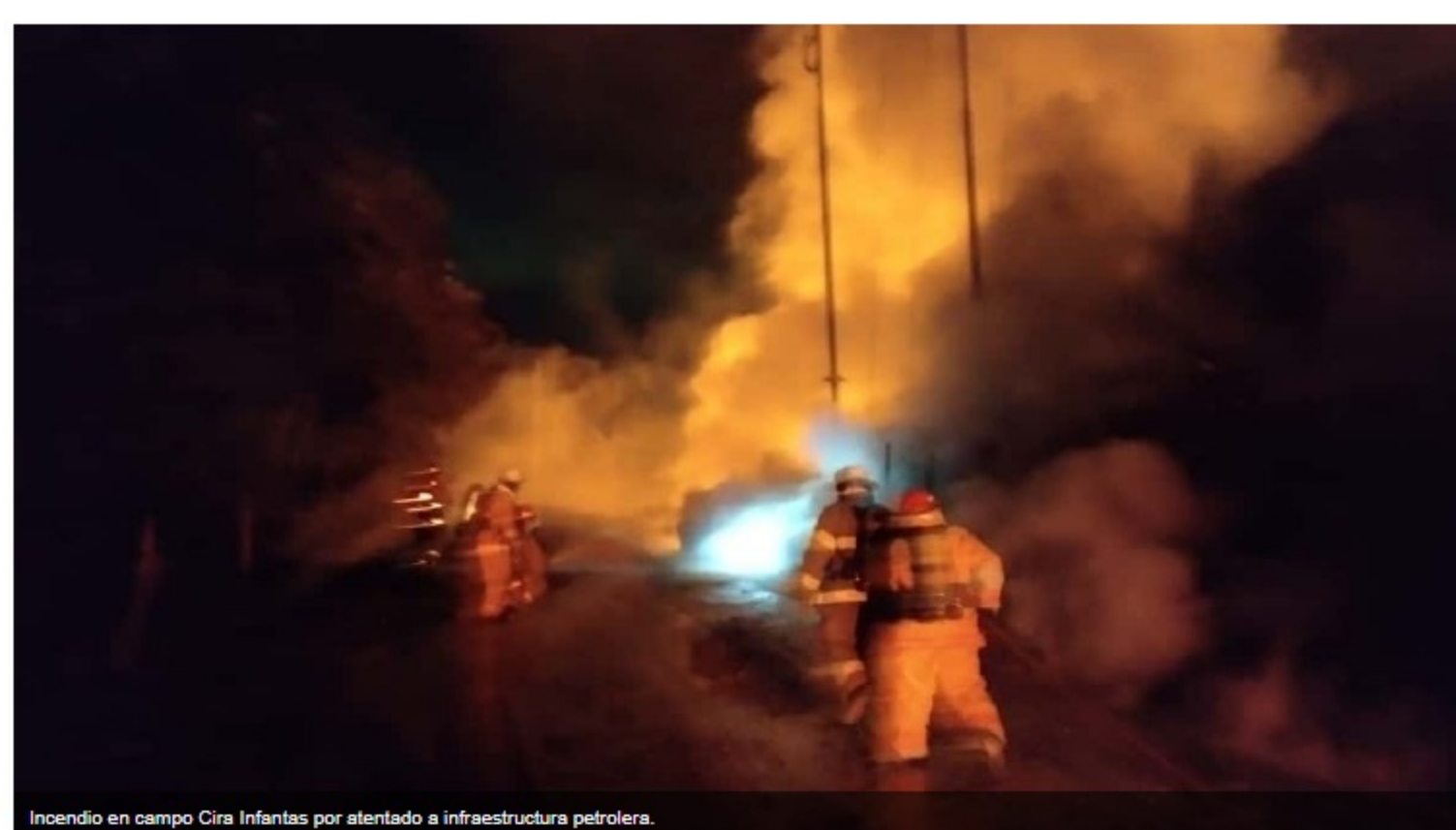
Incendio en campo Cira Infantas por atentado a infraestructura petrolera.