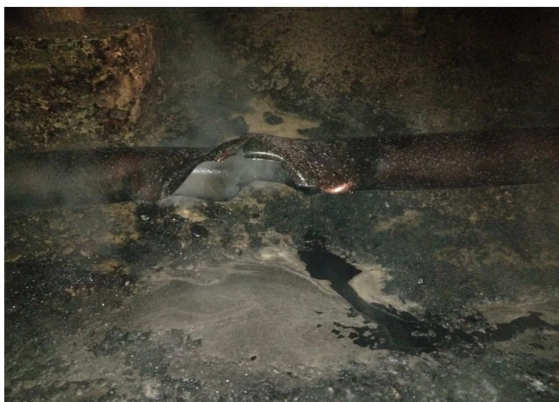
BLU Radio. Atentado en Barrancabermeja

Explosiones provocaron daños en el campo petrolero La Cira Infantas.