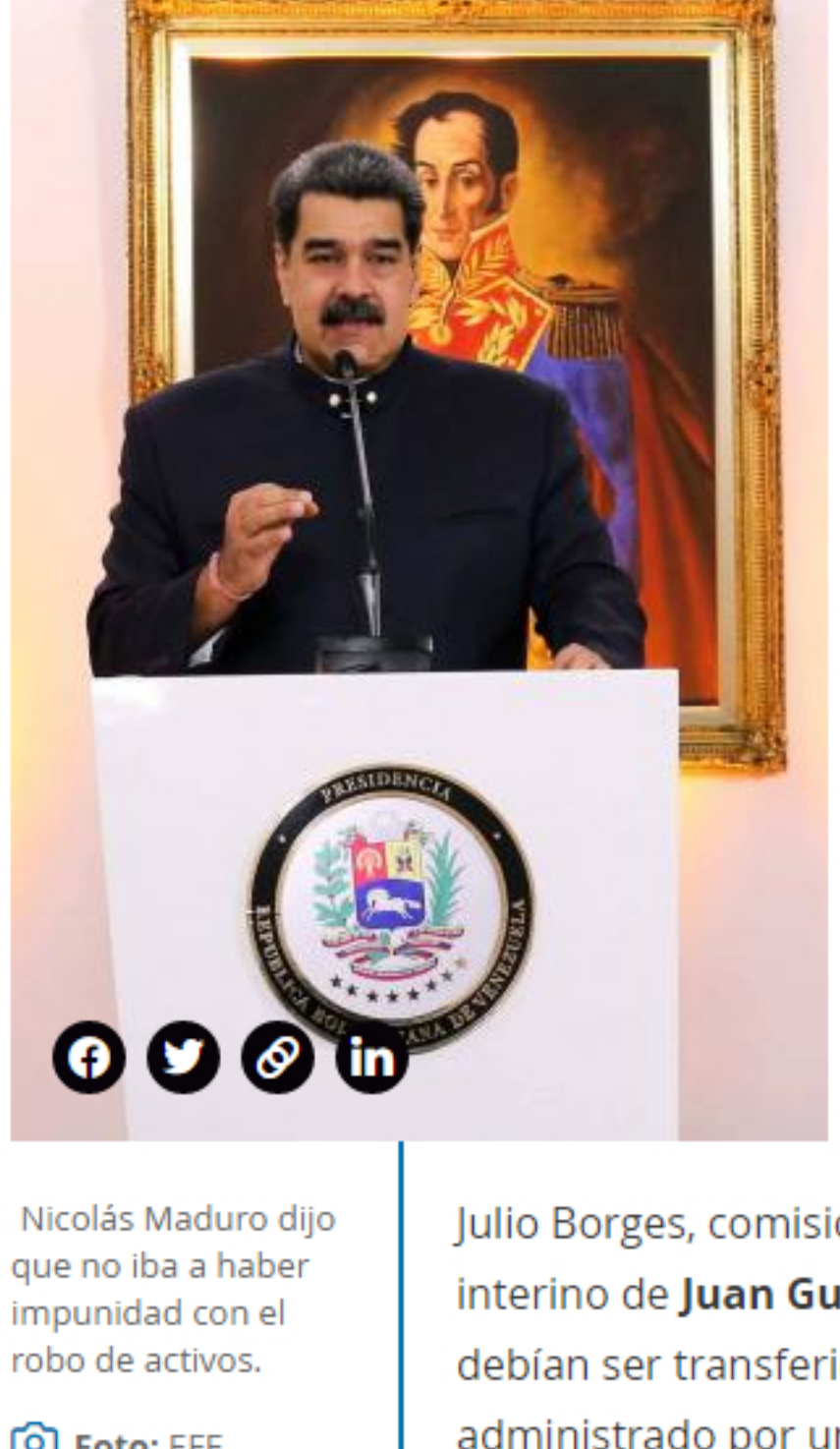
Nicolás Maduro dijo que no iba a haber impunidad con el robo de activos.

Al cierre de esta edición se esperaba un pronunciamiento de Maduro . Sin embargo, el domingo dijo, en una entrevista en el canal estatal, que no iba a haber impunidad con el robo de activos .