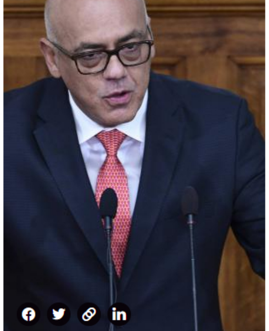
Presidente de la Asamblea Nacional de Venezuela, Jorge Rodríguez.

Reciba noticias de EL TIEMPO desde Google News