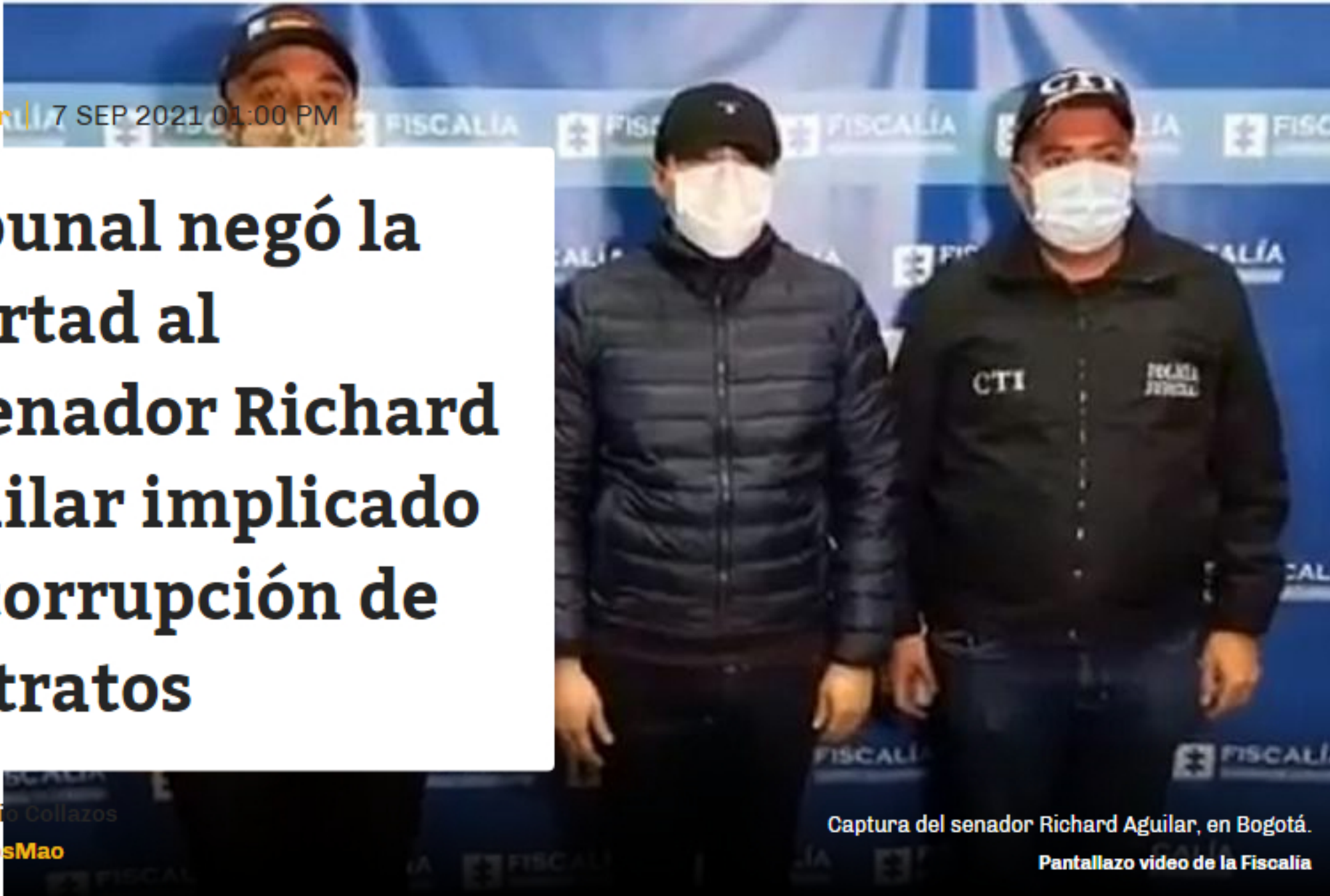
Captura del senador Richard Aguilar, en Bogotá.

La Fiscalía pedía mantenerlo detenido y la Procuraduría reclamaban que Aguilar debía ser dejado en libertad.