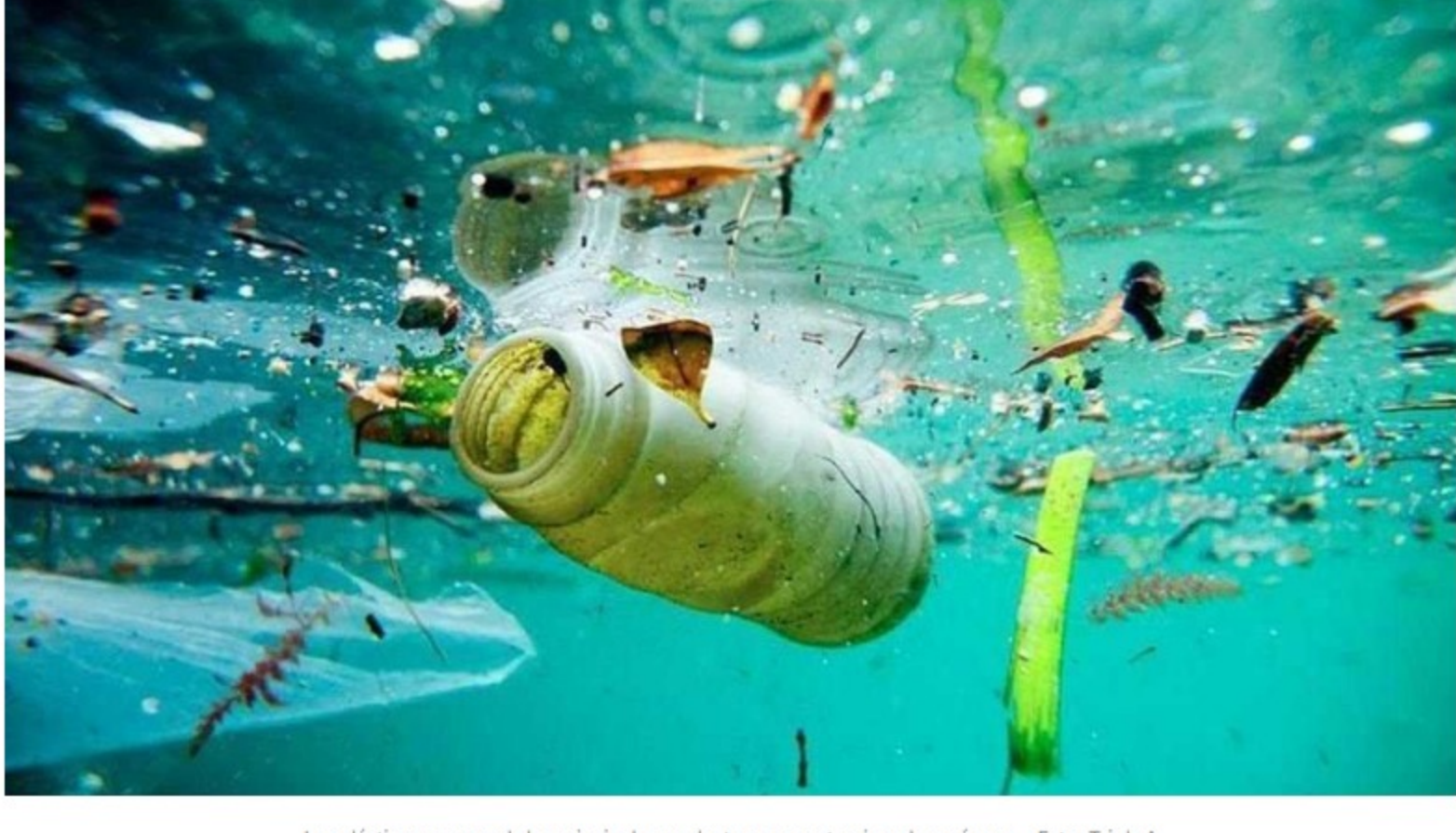
Los plásticos son uno de los principales productos que contaminan los océanos.

La comunidad internacional debe comprometerse a interrumpir el vertido de plástico en los mares de aquí a 2030, pide la organización.