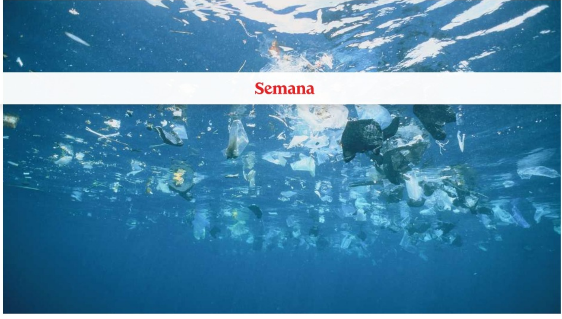
Basura de plástico

Si no se reducen los efectos de la contaminación del plástico, el costo de este material podría ascender hasta los US$7,1 billones. 5/9/2021