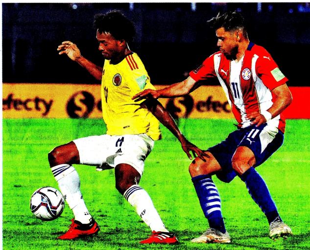
Juan Guillermo Cuadrado anotó el tanto de Colombia, de pena máxima, luego de una revisión del VAR.

El ministro de Ambiente, Carlos Eduardo Correa, dijo que pese al incremento del 8 por ciento en la deforestación en 2020, este año ya hay mejoría, al registrarse una reducción del 30 por ciento en el primer trimestre, gracias al control de más de 14.000 hectáreas con la operación Artemisa, tecnología y la ley de delitos ambientales. Y señaló que se prevé presentar en octubre el proyecto de ley para ratificar el Acuerdo de Escazú sobre la protección de líderes ambientales. Colombia / 1.5