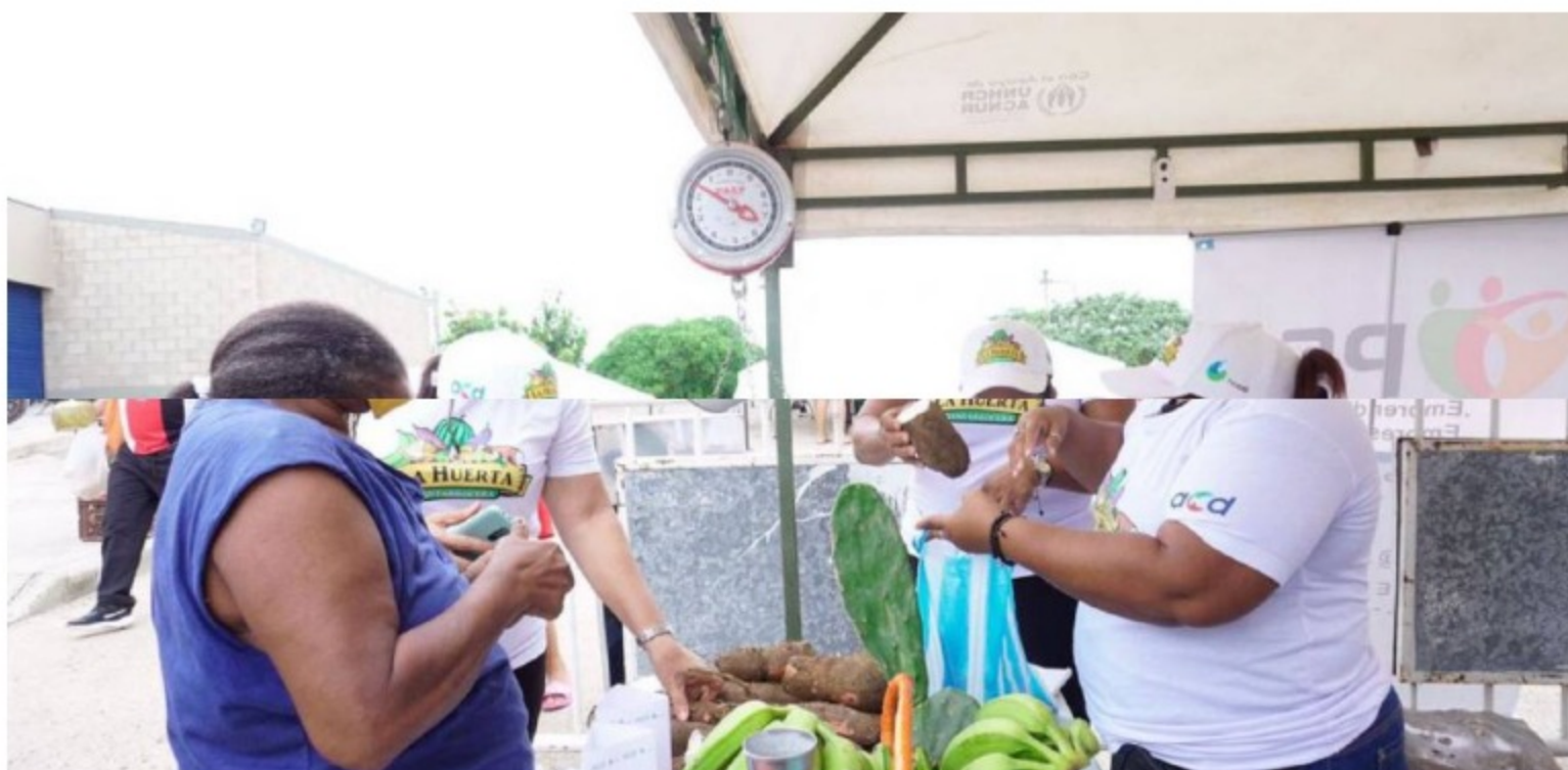
Alimentos / Mercado campesino Ciudad del Bicentenario

Estos productos son provenientes de los Montes de María